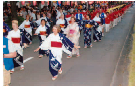
国境を越えた赤十字PR

作りは大変なことですが、毎年喜ばれています。また、夏祭りでは2年前から流し踊りに参加して