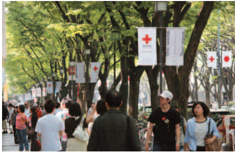
5月の表参道は赤十字カラー

5月1日(土)から14日(金)まで、新緑の原宿表参道が、赤十字カラーに染まります。